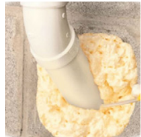
Mousse adhésive fabriquée à partir de dérivés du bois.

BIOMATERIAUX DANS LA CONSTRUCTION : Les composants chimiques du bois peuvent également être utilisés dans la production de matériaux de construction tels que les panneaux d'isolation, le bois chimiquement modifié avec transparence, résistance et biodégradabilité, les céramiques, etc.