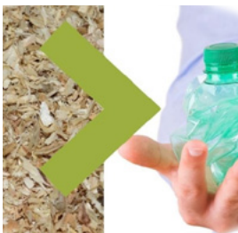
Production de bioplastiques à partir de poussière de bois

BIOPLASTIQUE : La fibre de bois peut remplacer le plastique dans de nombreuses applications (toitures, meubles, brosses, jouets, produits ménagers, etc.) La fibre de carbone, par exemple, qui est actuellement fabriquée à partir de combustibles fossiles, peut être produite à partir de la lignine, issue du bois.